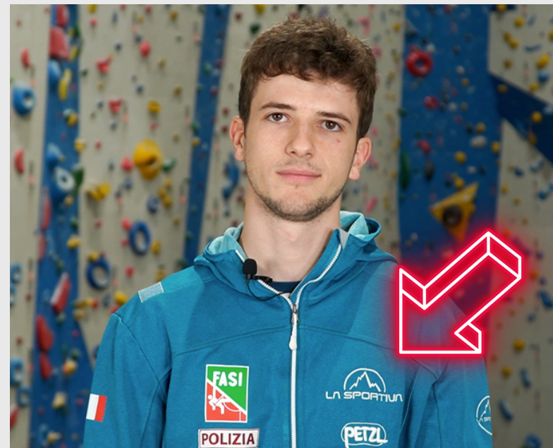
LOGO BRAND ATLETA